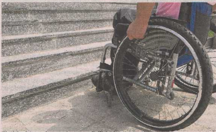
El objetivo es lograr la accesibilidad universal. DFA

El Ayuntamiento de Zaragoza ha puesto en marcha un Plan para la Rehabilitación Residencial con cuatro líneas de ayudas para mejorar la eficiencia y la accesibilidad en edificios y viviendas, con una partida específica dirigida a personas con discapacidad. El plazo para la presentación de so-