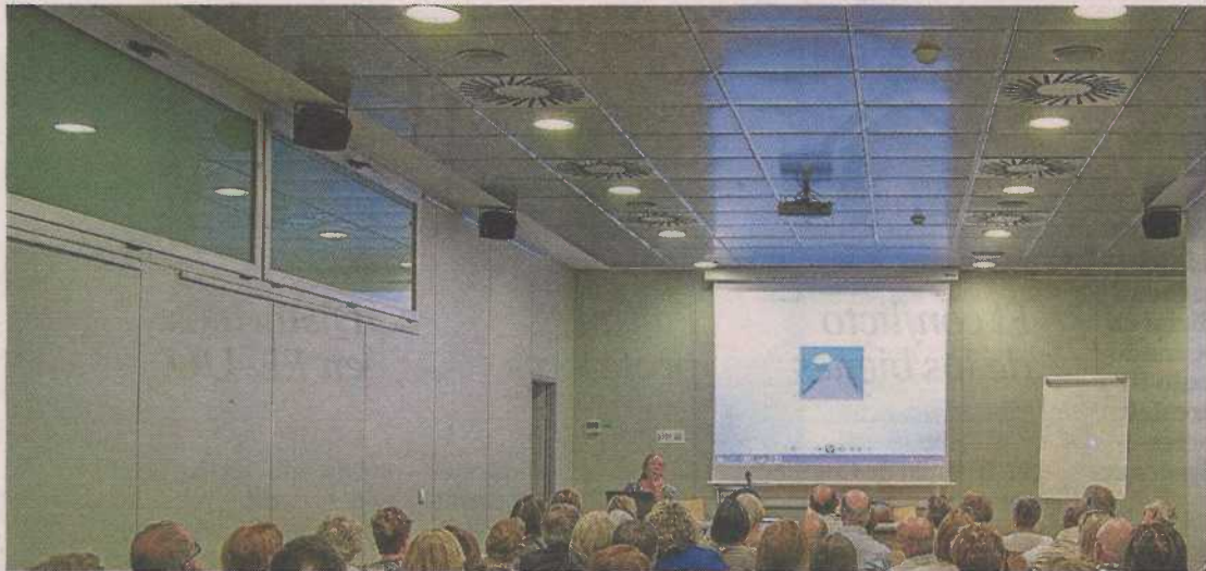
Grupo de alumnos el curso pasado en el Centro Joaquín Roncal CAI.

Desde el pasado lunes, 21 de septiembre, y hasta el 10 de octubre queda abierto el plazo de inscripción para los cursos de Fundación CAI en Zaragoza, Huesca y Teruel. Este año, la entidad ofrece 47 cursos adaptados a las nuevas necesidades. La mayoría de los