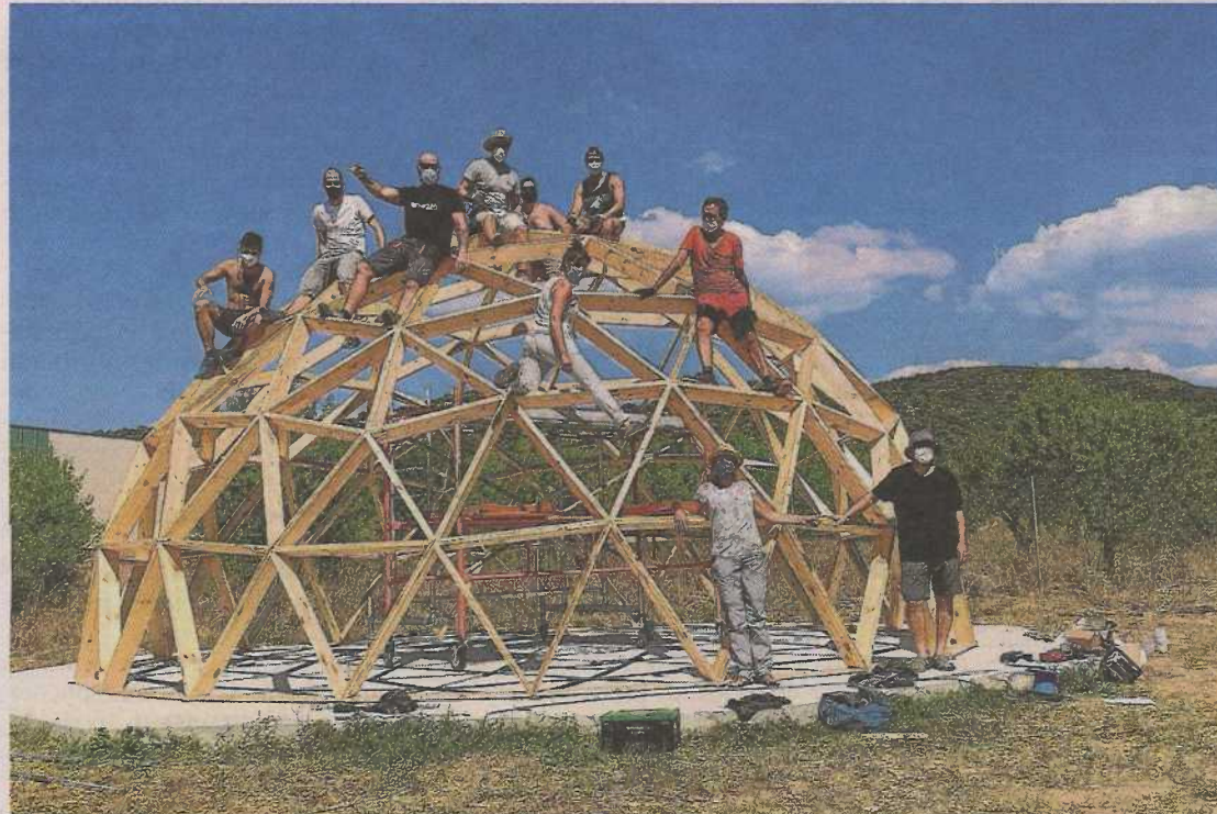
Construcción del domo y grupos de padres de usuarios de Down Huesca que, con su trabajo voluntario, hacen realidad el albergue La Sabina. DH

El domo o cúpula geodésica es una estructura basada en la figura geométrica del icosaedro. El de La Sabina ha sido construido con 480 tabloncillos que han generado 160 triángulos. Los materiales han sido donados por varias empresas de Barbastro y Monzón: Ernesto Cáncer, Muebles Aneto, Annona, Aula de Arte María Maza, Barpibas, Varaneo, Furnitra, Cerramientos B2, Big Metal Inox y Fortea. Su singularidad es que permite encerrar el máximo espacio con la mínima superficie, reduciendo así los costes de material y la energía